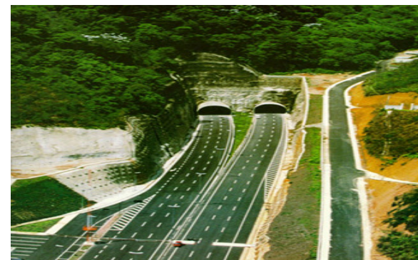
Linha Amarela - Rio

Ex. [Rio]: Linha Amarela : áreas particulares que projetem publicidade para a autopista.